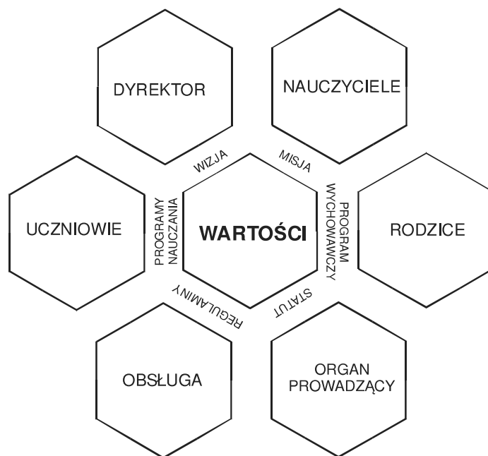
Rysunek 2. System wartości w organizacji szkolnej